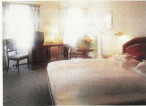
Elegant die Zimmer, gewinnend das Restaurant.

Die Zimmer sind elegant eingerichtet, haben Burgcharakter. Helle, freundliche